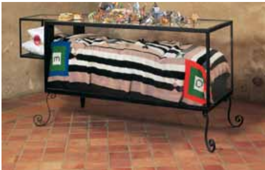
Patrick Van Caeckenbergh, Het Bed , 1994

Installation Matériaux divers 90 x 180 x 60 cm © Patrick Van Caeckenbergh Collection Frac des Pays de la Loire