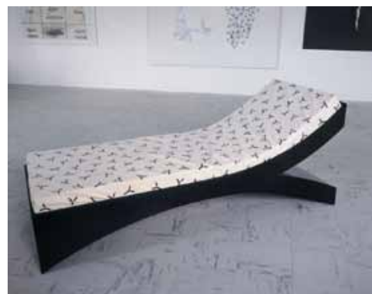
Yvan Le Bozec, Le Divan d'Yvan , 1996

Photographie noir et blanc rehaussée à la peinture à l'huile contrecollée sur aluminium 92 x 62 cm Collection Frac des Pays de la Loire