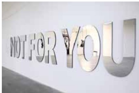
Monica Bonvicini, Not For You , 2009

Transfert d'une photocopie noir et blanc et d'une photocopie couleur sur papier ancien, rehaussé de crayon de couleurs, stylo-bille et fard à paupières 37,3 x 43,6 cm Collection Frac des Pays de la Loire