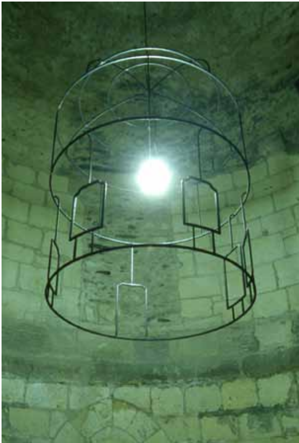
Sarkis, 4 chandeliers d'Angers , 1993

Luminaire Fer forgé, ampoule 150 x 100 cm © Adagp Collection Frac des Pays de la Loire