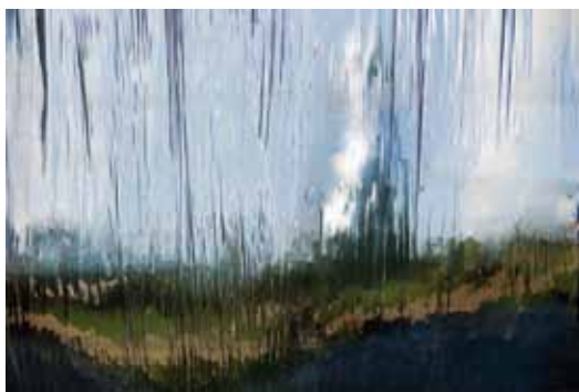
Tania Mouraud, Borderland (n°1619) , 2008

Tirage jet d'encre sur papier fine art 43,5 x 63,3 cm Collection Frac Poitou-Charentes