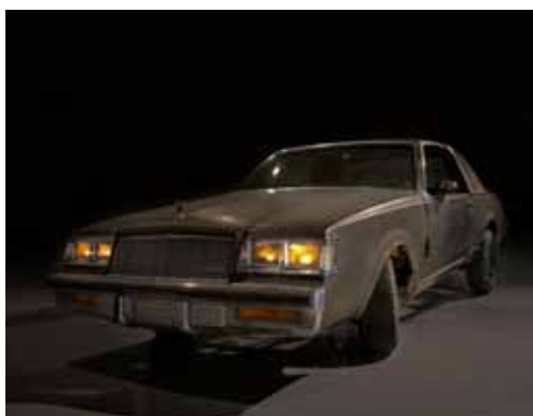
Michel de Broin, Shared Propulsion Car , 2005

Voiture (Buick Regal) customisée Photo : Michel de Broin Collection Frac Poitou-Charentes