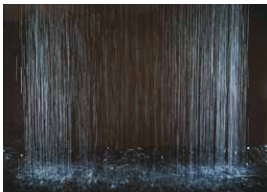
Patrick Tosani, La pluie seule , 1986

Photographie couleur 77,8 x 97,8 cm Collection Frac Poitou-Charentes