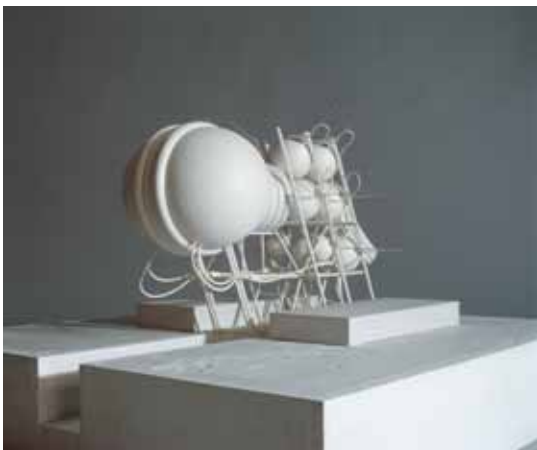
Coop Himmelb(l)au, Villa Rosa , 1967

Installation 12 tables avec photographies noir et blanc sous plexiglas, 20 tabourets en bois peint, 5 photographies encadrées noir et blanc au mur, une enseigne éponyme en néon, un pendule, câbles électriques Matériaux divers Dimensions variables Collection Frac des Pays de la Loire