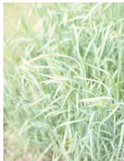
Jean-Luc Moulène, Monochrome Vert Nature Surex, Paris, Eté 1988 , 1988

Tirage jet d'encre sur papier fine art 43,5 x 63,3 cm Collection Frac Poitou-Charentes