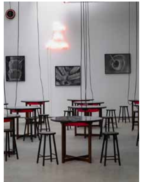
Jean-Luc Vilmoth, Bar des Acariens , 1991

Installation 12 tables avec photographies noir et blanc sous plexiglas, 20 tabourets en bois peint, 5 photographies encadrées noir et blanc au mur, une enseigne éponyme en néon, un pendule, câbles électriques Matériaux divers Dimensions variables Collection Frac des Pays de la Loire