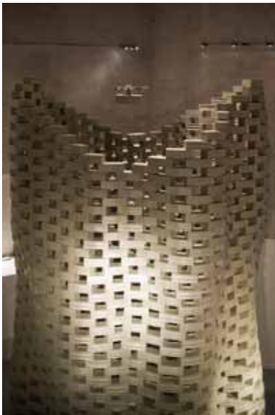
Gramazio & Kohler et Raffaello D'Andrea, Flight Assembled Architecture , 2011 Photo : François Lauginie © Gramazio & Kohler and Raffaello D'Andrea in cooperation with ETH Zurich Collection Frac Centre