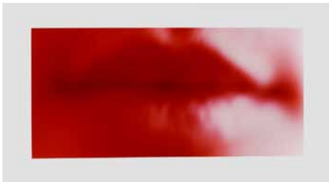
Sam Samore, Oasis #2 , 1990

Photographie couleur 92 x 166 cm Collection Frac Poitou-Charentes